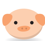
돼지고기를 먹지 못합니다. 豚がだめ