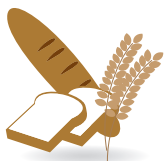
밀을 먹지 못합니다. 小麦がだめ