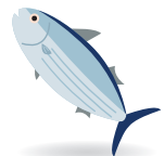
생선류 먹지 못합니다. 魚がだめ