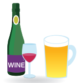
알코올을 마시지 못합니다. アルコールがだめ

8 잘 알겠습니다. 더 주문하실 것은 없습니까? 챤랴르겡스민다 도- 쵸뮌나실르 곱스민 오프스민다 かしこまりました。ご注文は以上でしょうか。