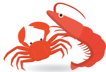
새우와 게를 먹지 못합니다. 海老や蟹がだめ